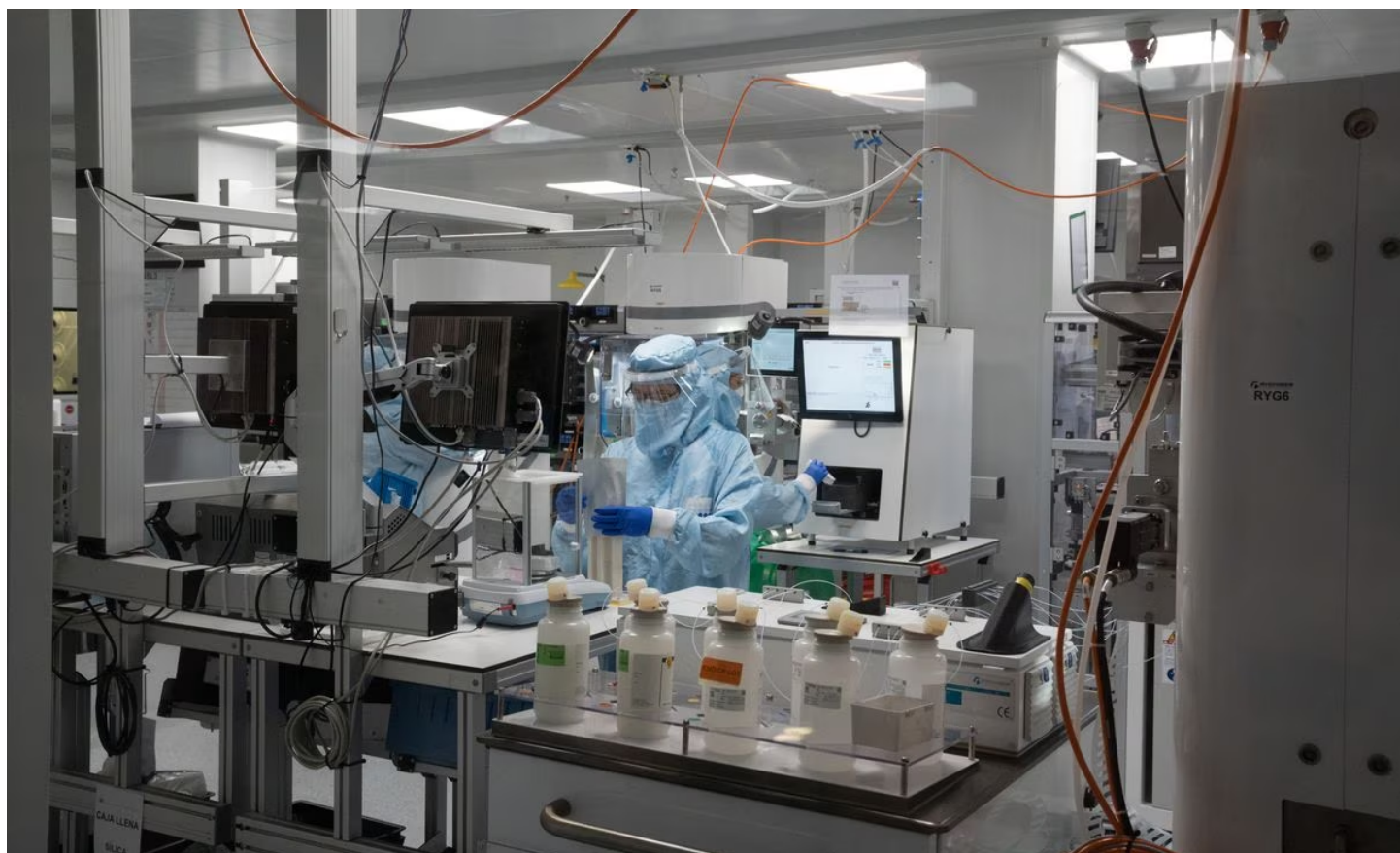
Uno de los laboratorios del Parque Científico de Barcelona (PCB), el 9 de marzo de 2023, en Barcelona.

Hace unos días el European Research Council (ERC) , institución que financia la investigación científica más vanguardista y de mayor calidad que se hace en Europa, hizo público los resultados de la convocatoria de 2022, referida a proyectos dirigidos por investigadores establecidos ( seniors ) en todos los campos del conocimiento. Se trata de los prestigiosos ERC advanced grants, que tienen una dotación de hasta 2.5 millones de euros por proyecto. Los investigadores españoles (o extranjeros que desarrollan su trabajo en instituciones españolas) han conseguido 16 ayudas, por detrás de países como Alemania (37) o Francia (32). Aunque los resultados de España son aceptables, muestran claramente el atraso que tenemos todavía en comparación con nuestros vecinos comunitarios. Sin embargo, lo que más llama la atención es la distribución de las ayudas dentro de España; más de la mitad de estas (nueve) van para Cataluña y las otras se reparten entre la Comunidad Valenciana (dos), la Comunidad de Madrid (dos), Andalucía (una), País Vasco (una) y Navarra (una).