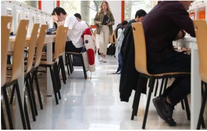
ELISA SILIÓ | MADRID