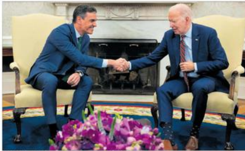
Pedro Sánchez y Joe Biden se dan la mano en su reunión en la Casa Blanca.

MEDIO AMBIENTE Aragón renuncia al proyecto de esquí Formigal-Astún